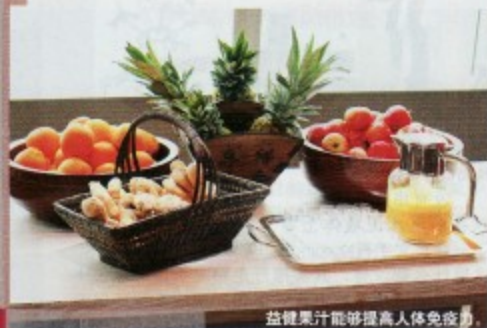
益健康汁能够提高人体免疫力。