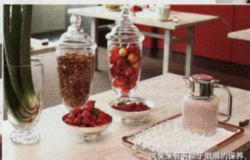
美味果昔有助于眼睛的保养。